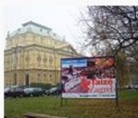
Zagreb Taizetreffen... 1.499.043 Bytes