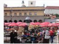
Dolac-zagreb.JPG 636.978 Bytes