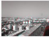
3D.jpg 727.371 Bytes