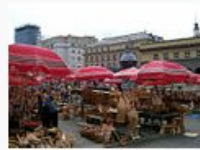
Dolac (Zagreb).jpg 91.641 Bytes