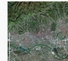
Zagreb SPOT 1038.jpg 158.461 Bytes