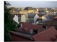
View from Lotrščak t... 104.688 Bytes