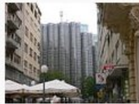
Moderne-zagreb.JPG 640.070 Bytes