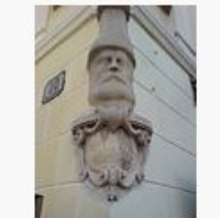
Zagreb city (4).JPG 766.345 Bytes