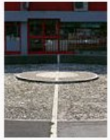
16 meridijan (Zagreb... 90.689 Bytes