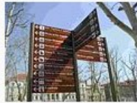
Attractions of Zagreb... 199.166 Bytes