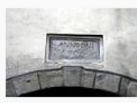
Ploča iznad Kamenit... 728.256 Bytes