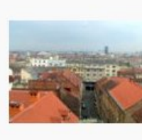
Zagreb panorama.jpg 1.535.133 Bytes