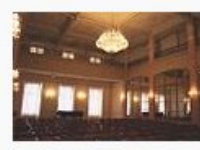
Preporodna dvorana2... 503.946 Bytes