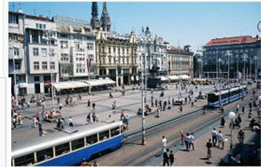
Der Ban-Jelačić-Platz, ein beliebter Treffpunkt der Zagreber