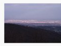
Dubrava s Medvedgrad... 576.596 Bytes