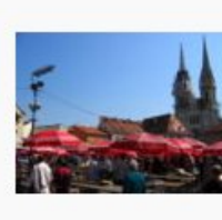
Zagreb, Dolac market... 534.600 Bytes