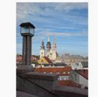
Zagreb city (5).JPG 666.653 Bytes